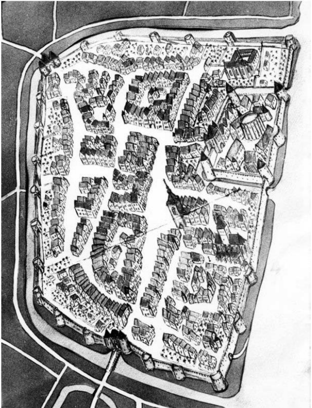
Dessin de Thionville, 16 ème siècle