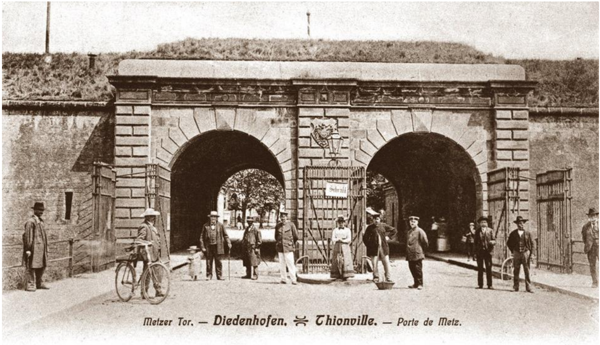
Metzer Tor. — Diedenhofen. ≡ Thionville. — Porte de Metz.