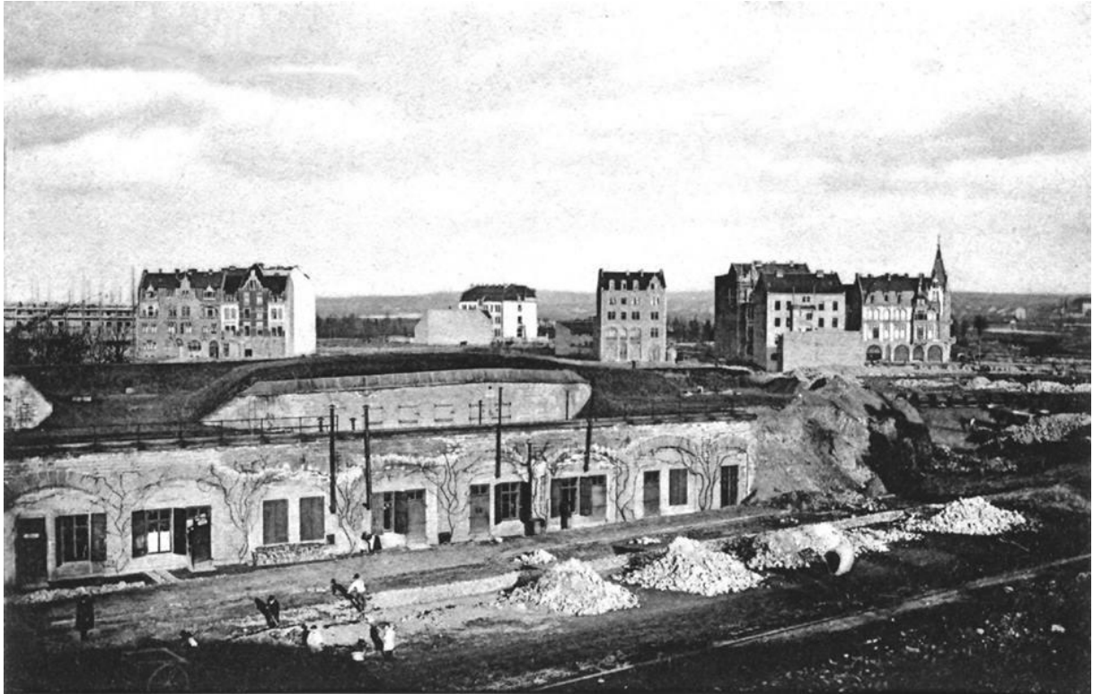
Démolition des remparts