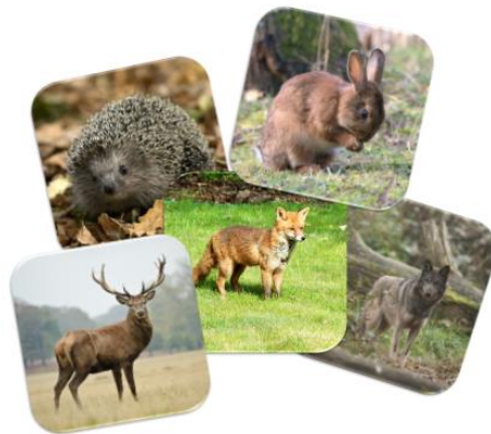
les animaux de la forêt

https://montessorimaispasque.com/2015/03/08/images-classifiees-les-animaux-de-nos-forets/